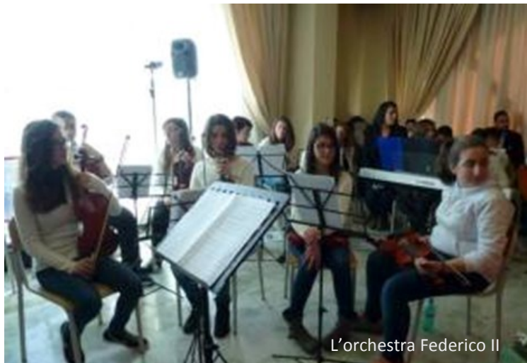
L'orchestra Federico II

Trebisacce, 11.2.2015 - La Grande Guerra, nel centenario della tragica estensione mondiale, oggetto di un percorso didattico e di riflessioni da parte degli studenti dell'Ipsia – Iti "Ezio Aletti" di Trebisacce e degli studenti dell'Istituto comprensivo "Federico II" di Rocca Imperiale. "Il Piave mormorò..." è stato il nome dato al convegno che ha riunito nel salone del Miramare Palace Hotel, rappresentanti istituzionali, dirigenti scolastici, docenti, storici e, soprattutto, studenti che, da veri protagonisti dell'evento, ne hanno illustrato i percorsi approfondendo ogni aspetto della Grande Guerra. Ad aprire i lavori il dirigente scolastico dell'Ipsia "Aletti" e reggente del Comprensivo "Federico II", Leonardo Viafora che ha evidenziato come "a cento anni dallo scoppio della Prima guerra mondiale, siamo chia-