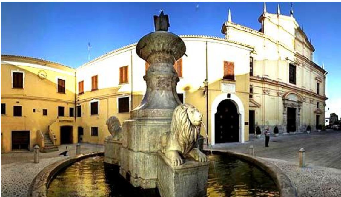
Fontana dei Tre Leoni – Vescovado e Basilica Minore “Santa Maria del Lauro”