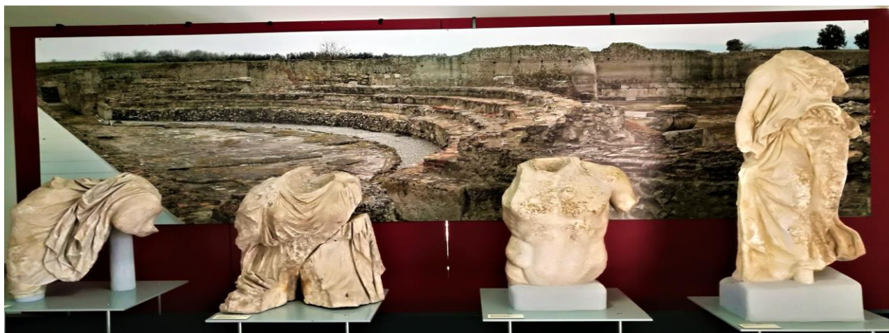
Museo di Sibari