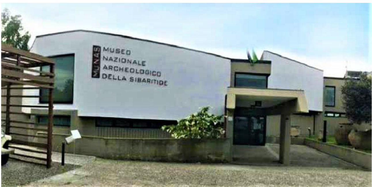
SIBARI – Museo Nazionale Archeologico