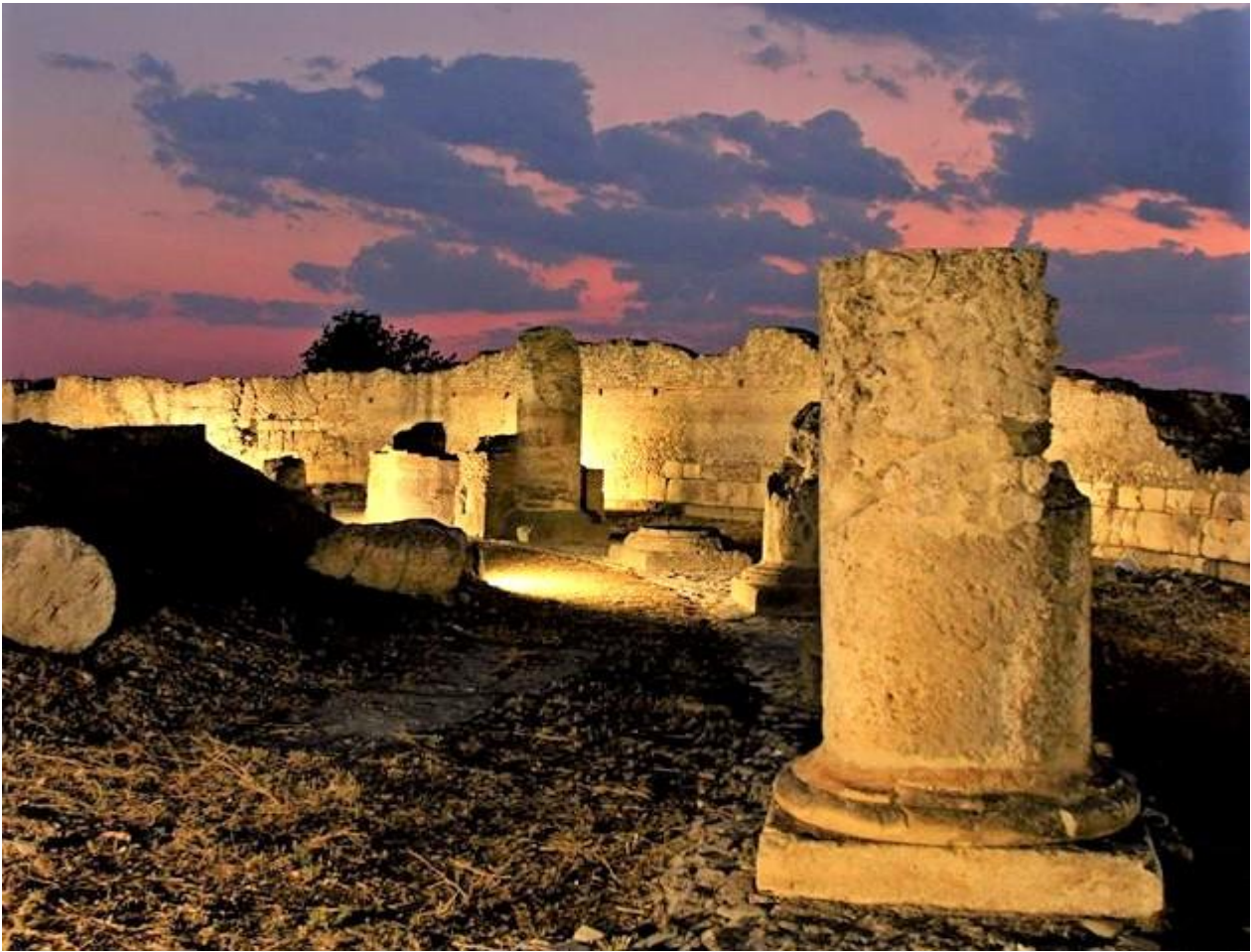
SIBARI – PARCO ARCHEOLOGICO DEL CAVALLO – Teatro Romano