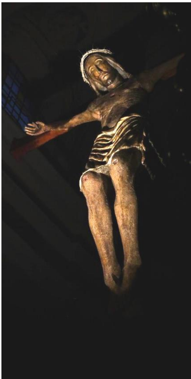
Crocifisso Santo Patrono della Città di Cassano All’Jonio