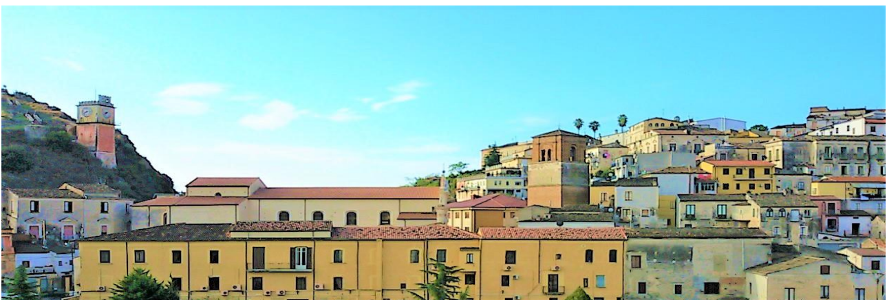
Cassano – Centro Storico