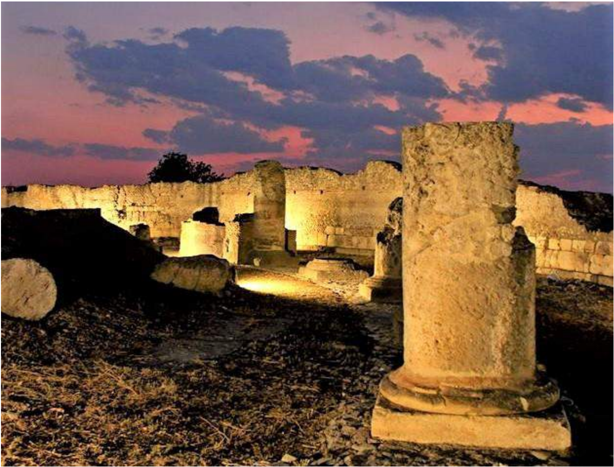
SIBARI – PARCO ARCHEOLOGICO DEL CAVALLO – Teatro Romano