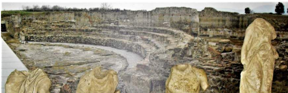
Parco Archeologico di Sibari – Teatro Romano

eseguiti entro il 30 giugno prossimo. Rimane vietato, recita, inoltre, l'ordinanza, effettuare lavori edili, che possano disturbare la quiete dei villeggianti nel periodo 01 luglio – 15 settembre 2021, esclusi i soli lavori di tinteggiatura. Gli inadempimenti saranno passibili delle sanzioni previste dall'art. 50 del D.Lgs 267/200 e il Comune si sostituirà nell'esecuzione d'ufficio con rivalsa delle spese sostenute. Ai fini della vigilanza e dell'esecuzione, l'ordinanza è stata trasmessa alla Polizia Locale del Comune di Cassano all'Ionio e a chiunque spetti per legge. Avverso il provvedimento, è ammesso ricorso al TAR entro 60 giorni, oppure, ricorso straordinario al Capo dello Stato entro il termine di 120 giorni dalla scadenza del termine di pubblicazione della stessa.