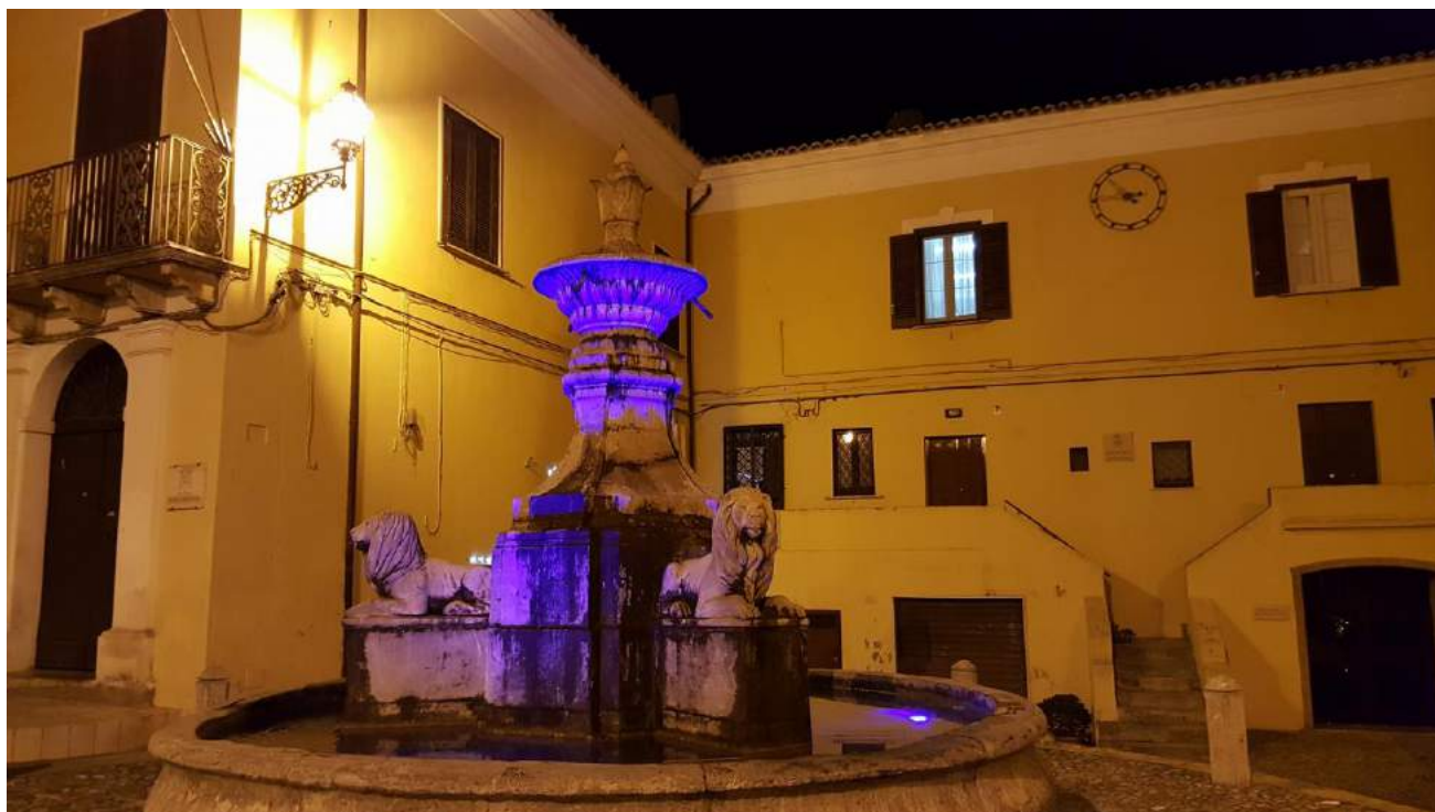
Piazza S. Eusebio - Fontana dei Tre Leoni