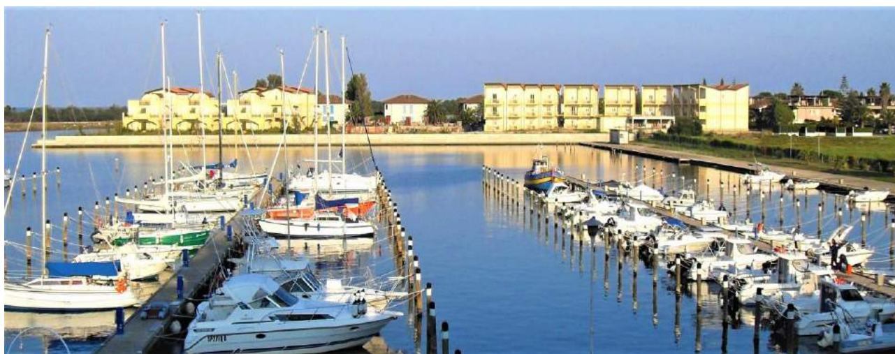
Laghi di Sibari