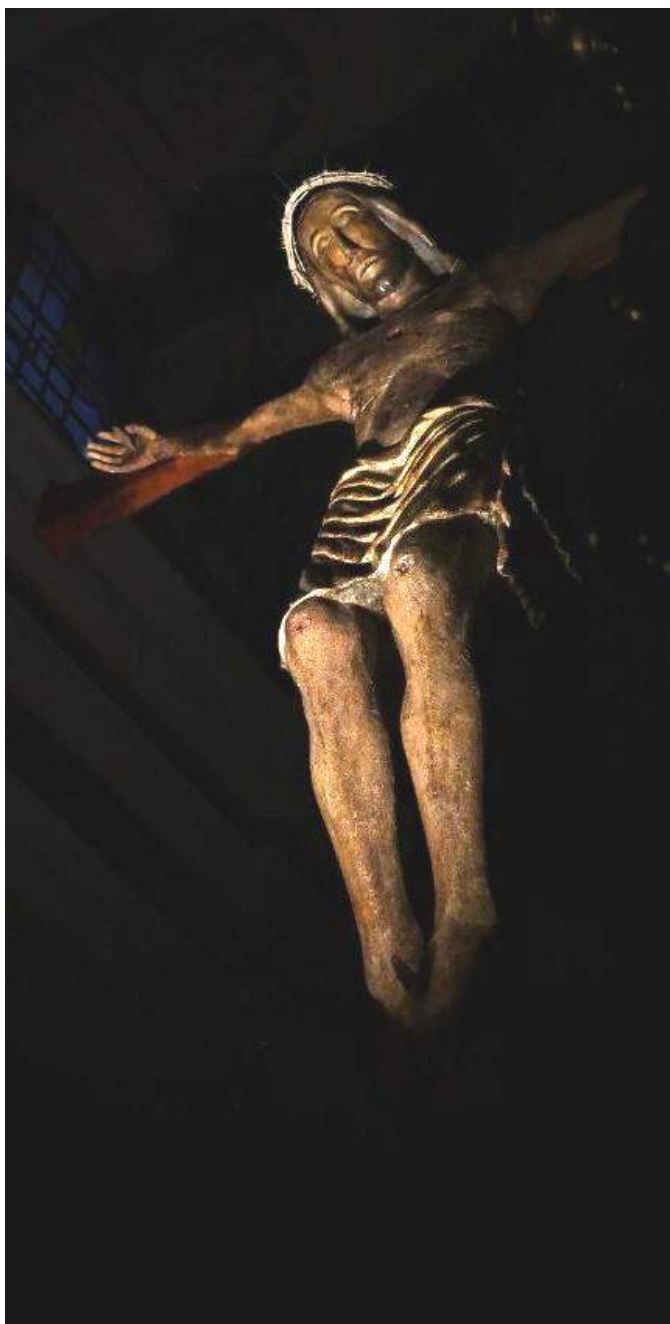
Crocifisso Santo Patrono della Città di Cassano All'Jonio